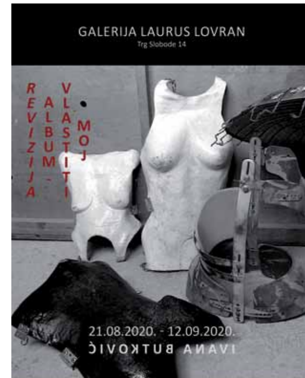
Otvoravanje izložbe: PETAK, 21. KOLOVOZA 2020. U 20 SATI Radno vrijeme: utorak, srijeda, petak: 17 - 21 h četvrtak, subota: 10 - 13 h / nedjelja, ponedjeljak: zatvoreno

Ta fascinacija nije napustila autoricu ni tijekom studija, ali ni nakon toga. Ona i dalje istražuje žive slike u pokretu i bilježi ih snimkama, slaže novu izložbu kao što je bila ova u Lovranu pod nazivom „Moj vlastiti album“ i kreće dalje, u nove likovne pobjede.