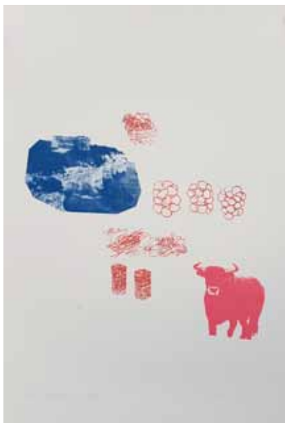
Ana Sladetić, Dream Map 01 , pronto plate litografija, 64x40 cm, 2016.