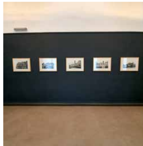
Miran Šabić, Urbana prolaznost , Edicija Argola, HAZU, 2020.