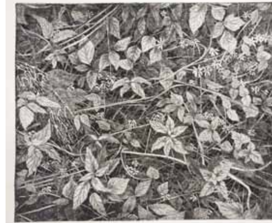
Miran Šabić, Šuma , bakropis, 54x64 cm, 2019.