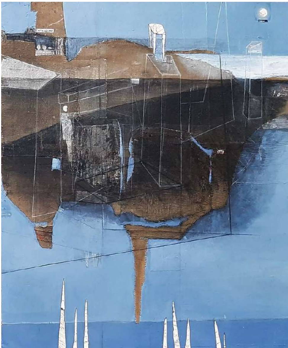
Stonehaven , 2023., kombinirana tehnika, diptih, 144x171 cm