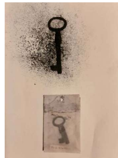
Dva ključa , 2025., kombinirana tehnika, 21x14 cm