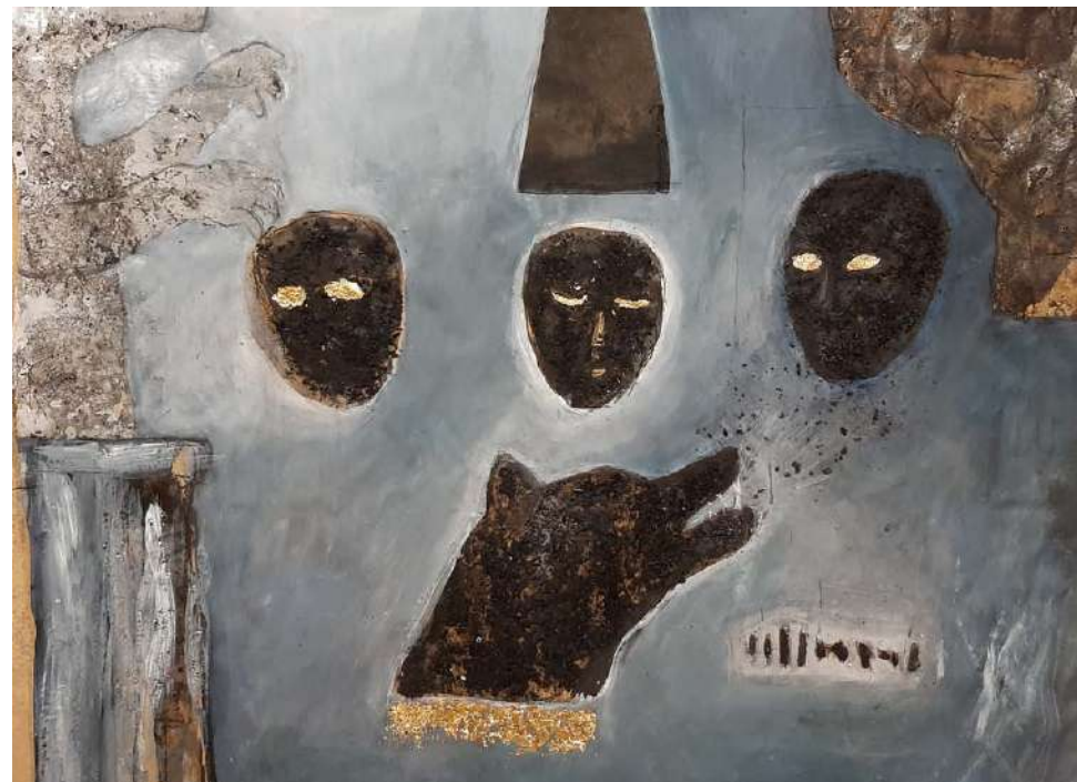
Crni pas , 2023. kombinirana tehnika, 110x94 cm

LOVORKA GRAČANIN rođena je 1973. godine Rijeci. Diplomirala je likovnu kulturu na Filozofskom fakultetu u Rijeci, smjer slikarstvo u klasi prof. Ksenije Mogin 1999. godine. Živi u Rukavcu i radi kao likovni pedagog u OŠ Čabar. Bavi se crtežom i slikarstvom te je izlagala na nekoliko skupnih i jednoj samostalnoj izložbi.